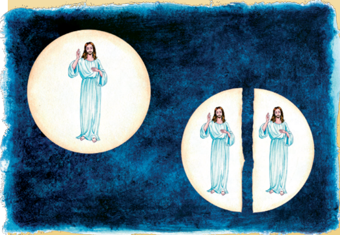
▲擘開祝聖後的麵餅並不是擘開耶穌的身體，耶穌完整地臨在每一片祝聖後的麵餅。 ▶可以直接口領聖體，或是以手接領聖體。

由於晴晴年紀還小，教導要理方面得循序漸進，不過倒是可以餵給她很多「故事」，要理配合生動的聖人故事，讓她從聖人聖女的榜樣中認識信仰。例如：我們的本堂是法蒂瑪聖母堂，就可以跟她介紹聖母顯現給露濟亞、方濟各和雅琴達3位牧童之前，天